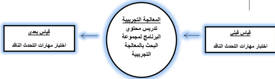
شكل (٣) مخطط التصميم التجريبي لمتغيرات الدراسة

ثالثاً: التصميم التجريبي والأساليب الإحصائية المناسبة: